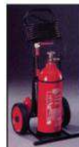
Τροχήλατος Πυροσβεστήρας διοξειδίου του άνθρακα (CO 2 ) 30 χιλιογράμμων

Ο αποπνιγμός, η ψύξη και η παρεμπόδιση της ακτινοβολίας συμβάλλουν στην κατασβεστική αποτελεσματικότητα της σκόνης, αλλά οι μελέτες που έχουν γίνει δείχνουν ότι η κυριότερη αιτία κατάσβεσης είναι η διακοπή της αλυσιδωτής αντίδρασης των φλογών.