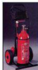
Τροχήλατος Πυροσβεστήρας διοξειδίου του άνθρακα (CO 2 ) 30 χιλιογράμμων

Ο αποπνιγμός, η ψύξη και η παρεμπόδιση της ακτινοβολίας συμβάλλουν στην κατασβεστική αποτελεσματικότητα της σκόνης, αλλά οι μελέτες που έχουν γίνει δείχνουν ότι η κυριότερη αιτία κατάσβεσης είναι η διακοπή της αλυσιδωτής αντίδρασης των φλογών.