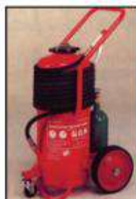
Τροχήλατος Πυροσβεστήρας ξηράς σκόνης 50 χιλιογράμμων