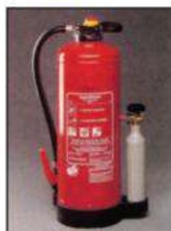
Πυροσβεστήρες ξηράς σκόνης με εξωτερικό φιαλίδιο