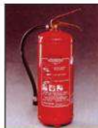
Πυροσβεστήρας ξηράς σκόνης συνεχούς πίεσης