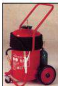
Τροχήλατος Πυροσβεστήρας μηχανικού αφρού 50 χιλιογράμμων