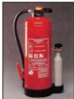
Πυροσβεστήρες ξηράς σκόνης με εξωτερικό φιαλίδιο