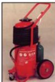
Τροχήλατος Πυροσβεστήρας ξηράς σκόνης 50 χιλιογράμμων