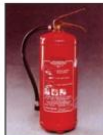
Πυροσβεστήρας ξηράς σκόνης συνεχούς πίεσης