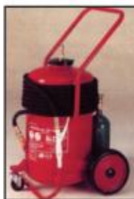
Τροχήλατος Πυροσβεστήρας μηχανικού αφρού 50 χιλιογράμμων