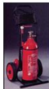
Τροχήλατος Πυροσβεστήρας διοξειδίου του άνθρακα (CO 2 ) 30 χιλιογράμμων

Ο αποπνιγμός, η ψύξη και η παρεμπόδιση της ακτινοβολίας συμβάλλουν στην κατασβεστική αποτελεσματικότητα της σκόνης, αλλά οι μελέτες που έχουν γίνει δείχνουν ότι η κυριότερη αιτία κατάσβεσης είναι η διακοπή της αλυσιδωτής αντίδρασης των φλογών.