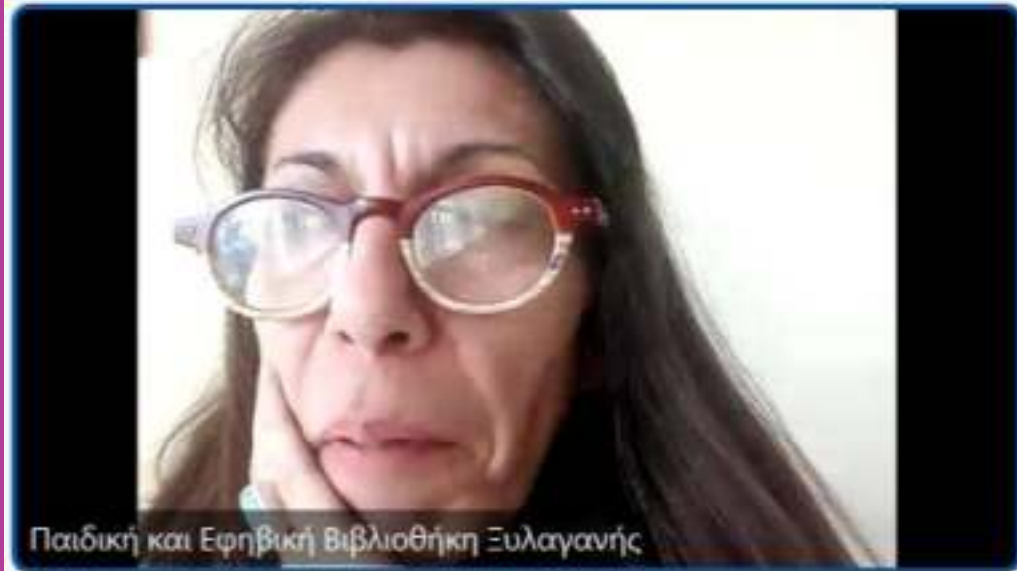
Παιδική και Εφηβική Βιβλιοθήκη Ξυλαγανής